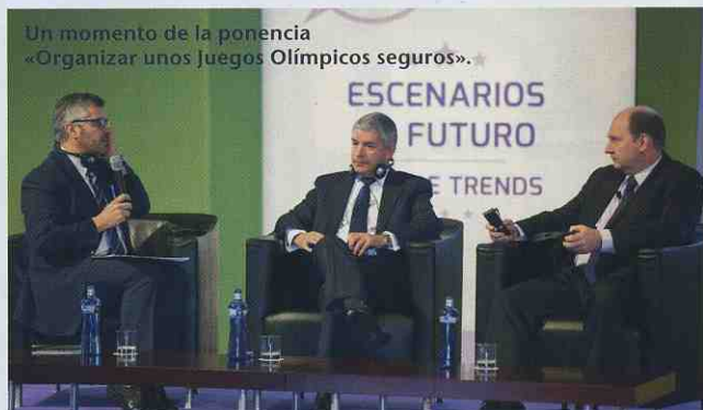
Un momento de la ponencia «Organizar unos Juegos Olímpicos seguros».