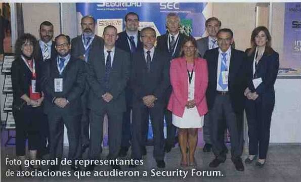
Foto general de representantes de asociaciones que acudieron a Security Forum.